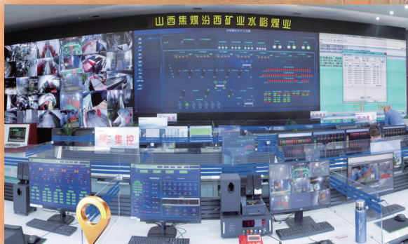
调度集控指挥中心