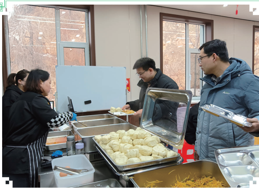
从3月份起,高阳煤矿井口食堂实行24小时全天候开放,最大限度满足所有班次职工的就餐需求,用心用情用力提升服务质量、增进民生福祉,受到广大干部职工一致好评。

(接上期) 第十二条 县级以上地方档案主管部门依照《档案法》第八条第二款的规定,履行下列职责:(一)贯彻执行有关法律、法规、规章和国家有关方针政策;(二)制定本行政区域档案事业发展规划和档案工作制度规范,并组织实施工;(三)监督、指导本行政区域档案工作,对有关法律、法规、规章和国家有关方针政策的实施情况进行监督检查,依法查处档案违法行为;(四)组织、指导本行政区域档案理论与科学技术研究、档案信息化建设、档案宣传教育、档案工作人员培训。