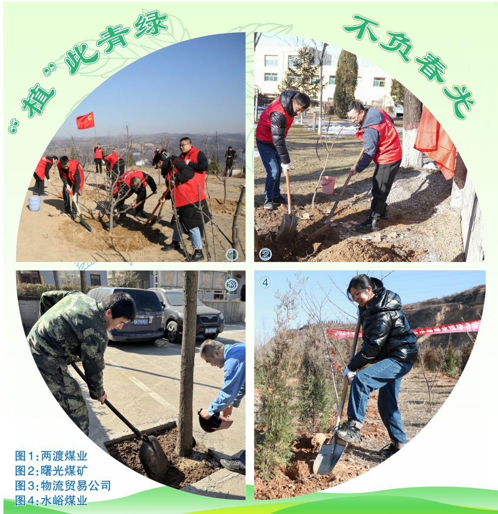
图1:两渡煤业 图2:曙光煤矿 图3:物流贸易公司 图4:水峪煤业

紧盯干部作风。宜兴煤业对干部纪律作风进行再提醒、再教育、再要求。通过召开重点领域警示教育会及学习典型案例、重温各项纪律规定等方式,引导干部员工增强廉洁自律意识。该公司严格按照“促落实、纠偏差,防风险、推整改”要求,坚持问题导向,见人见事,动真碰硬,推动各项决策部署落实到位、各类问题整改及时、监督检查取得成效。截止目前,该公司开展作风督导6次,下发通报1期,整改问题30余条,约谈提醒14人。 (王飞仙)