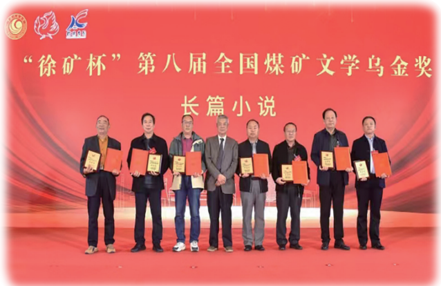
“徐矿杯”第八届全国煤矿文学乌金奖