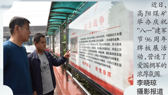
近日,高阳煤矿举办庆祝“八一”建军节96周年牌板展活动,营造了爱国拥军的浓厚氛围。