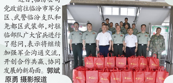
近日,临汾公司党政前往临汾市军分区、武警临汾支队和尧都区武装部,对驻临汾队广大官兵进行了慰问,表示将继续加强军企沟通交流,开创合作共赢、协同发展的新局面。