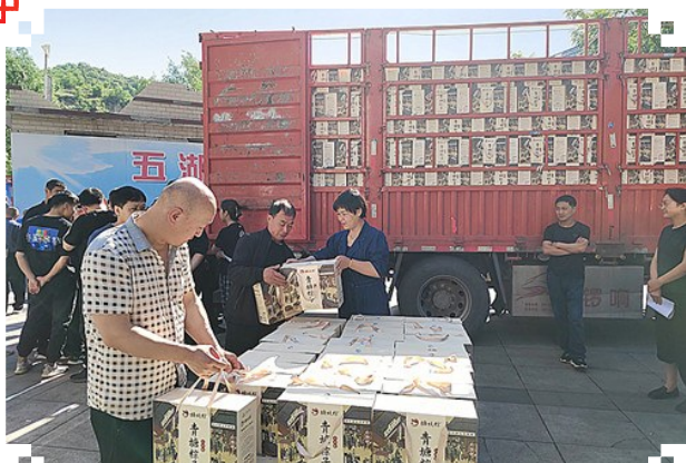
又是一年端午节,深情嘱安全。端午节来临之际,贺西煤矿工会组织为职工发放了粽子礼盒,让大家拥有了归属感和幸福感。

近日,四通煤业工会组织开展了“送清凉、嘱安全、鼓干劲”慰问活动。为高温下坚守岗位的职工送去丝丝凉意和诚挚关怀。活动中,女职工自制酸梅汤,向出入井职工发放雪糕,把企业的关爱送给职工,用亲情的话语鼓舞广大职工战高温、斗酷暑、促生产、保安全的斗志,嘱咐大家牢固树立安全意识,按章作业,劳逸结合,确保安全。