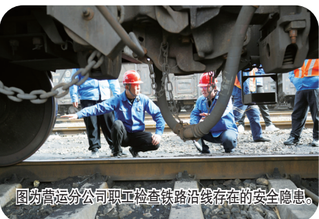
图为营运分公司职工检查铁路沿线存在的安全隐患。

该公司要求,各级人员要严格落实汾西矿业安全操作红线管理制度,严格执行“行车不行人、行人不行车”安全规定,严格落实好“三项举措”,打好“三大战役”,切实强化现场安全动态管理,层层压实安全管理责任,确保安全生产大检查百日攻坚行动顺利完成。(耿婕 李雪)