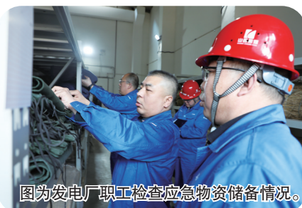
图为发电厂职工检查应急物资储备情况。

应急库中应急救援物资的储备种类、数量、保质期和维护落实情况进行检查,确保储备物资状态良好,在关键时刻找得到、拿得出、用得好。(史乐、殷圣恩)