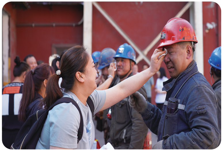
近日，临汾公司吴兴煤业组织开展了“井口送温暖、矿嫂嘱平安”活动。随着综采队零点班员工乘车升井，等候已久的家属们递上牛奶、毛巾，仔细询问家人在井下工作情景，叮嘱大家一定要增强安全意识，做好安全防护，让员工真切地感受到了浓浓的关爱。

下一步，我们将不断完善此项工作，并逐步推广至地面其他队组及管理部门，从而确保各层级都能压实责任，当好第一责任人，确保矿井安全、有序、健康、稳定发展。