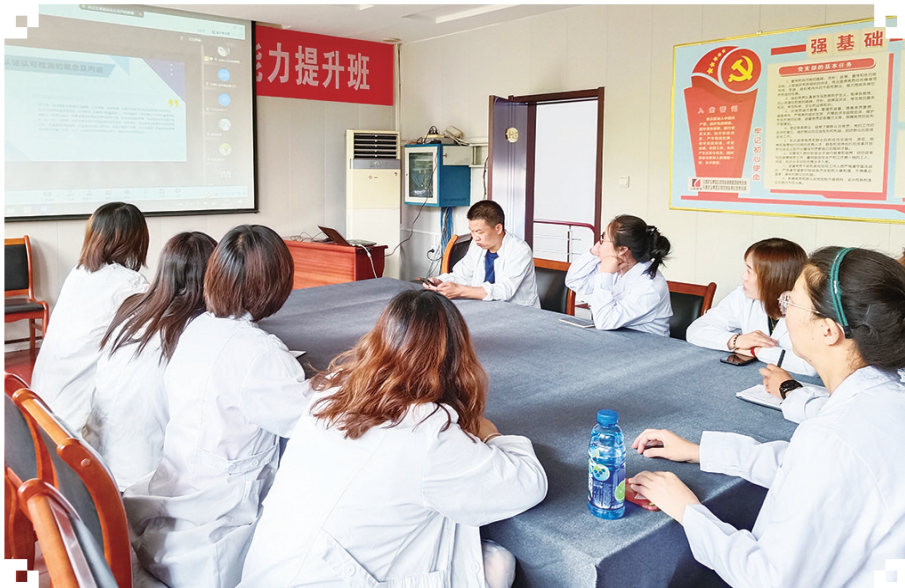
为深入贯彻习近平总书记重要指示精神，贯彻落实党中央、国务院决策部署，积极宣传推动认证认可检验检测工作，近日，环境监测公司组织化验员统一收看省市场监管局组织的“认证认可检验检测”视频培训。图为培训现场。