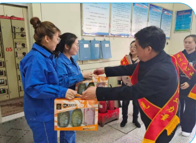
右:曙光煤矿工会女工委,深入基层岗位,为坚守岗位、甘于奉献的在岗女职工,送上精心准备的暖心大礼包,并致以“娘家人”的节日问候!

女职工开展比划猜词、穿越呼啦圈、多人踩气球等一系列小活动,既有挑战、竞争,又充满了欢声笑语。李平 摄