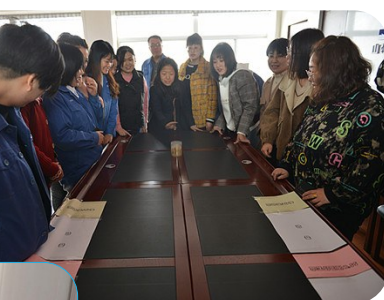
上下图分别为营运分公司、中兴煤业举办的趣味游艺活动。