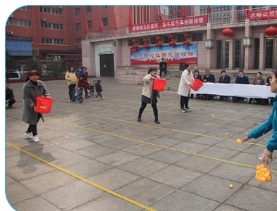
上:水峪煤业召开了2021年纪念“三八”妇女节表彰会暨女工家属工作会,并有抢凳子、百发百中、反口令、蒙眼敲锣等趣味项目轮番上演,女工们在欢快娱乐的氛围中度过自己的节日。水宣