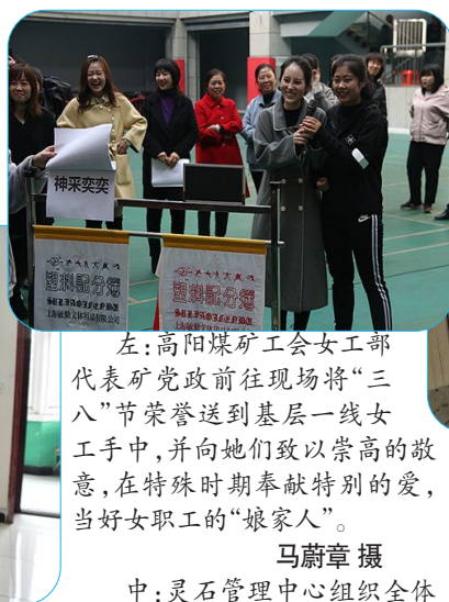
左:高阳煤矿工会女工部代表矿党政前往现场将“三八”节荣誉送到基层一线女工手中,并向她们致以崇高的敬意,在特殊时期奉献特别的爱,当好女职工的“娘家人”。